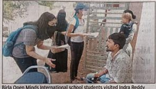
Nagar, Shankarpalle as part of an internship

"Our study clearly showed that there are serious problems regarding water supply, drainage, roads, and employ-